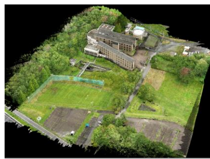
図 1：文化財（UAVとデジカメ） 図 2：法面崩落・クラック 図 3：UAVレーザと写真合成